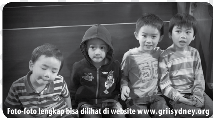
Foto-foto lengkap bisa dilihat di website www.griisdney.org